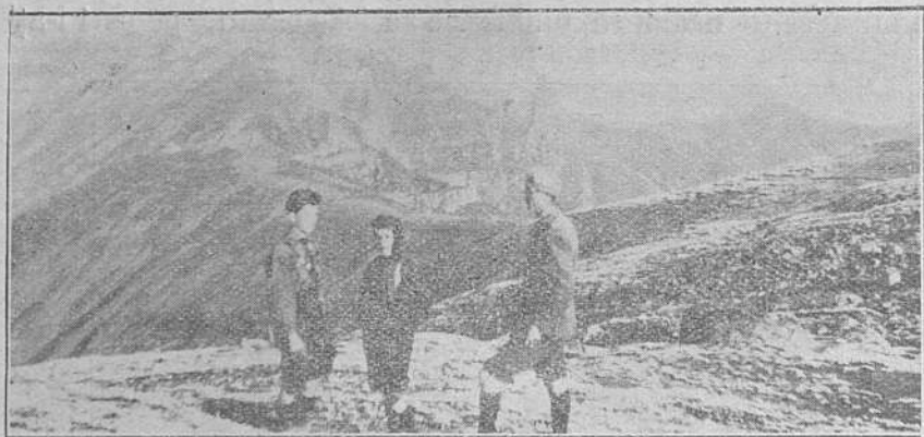
Vedere din Bucegi