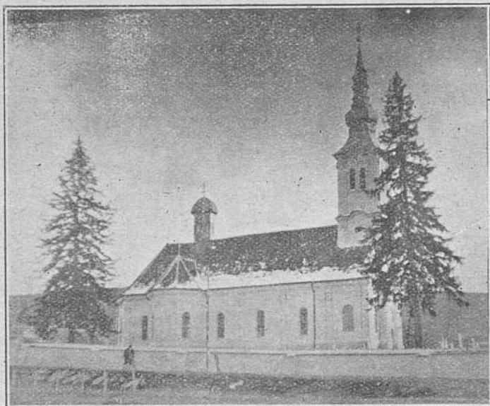
Biserica Sf. Adormiri din Satulung

mii odată cu voi pentru fanatismul aceluiași ideal, — ca destinul acestui neam să umble pe aceleaș cărări, pe cari l-ați