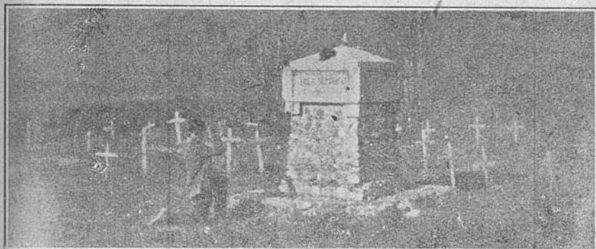
Cimitirul eroilor din Satulung Șanțuri.