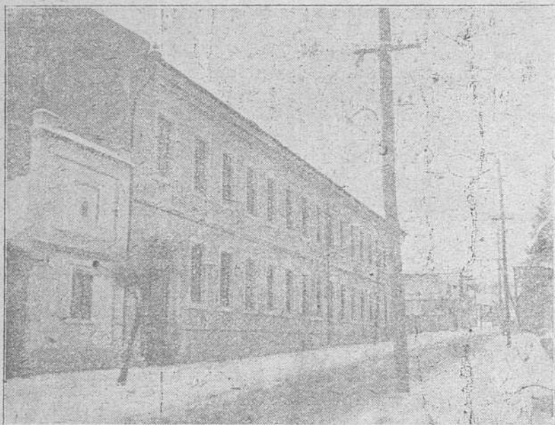
Gimnaziul de băeți din Satulung-Săcele.

În lupta pe care Ungurii au dat-o pentru desnaționalizarea comunelor cu populație românească, școala era unul din mijloacele cele mai eficace. Prin așezarea la graniță și prin structura lor românească Săcelele se numărau printre redutele pe care Ungurii trebuiau să-le cucerească, fie pe calea colonizărilor, fie prin școală.