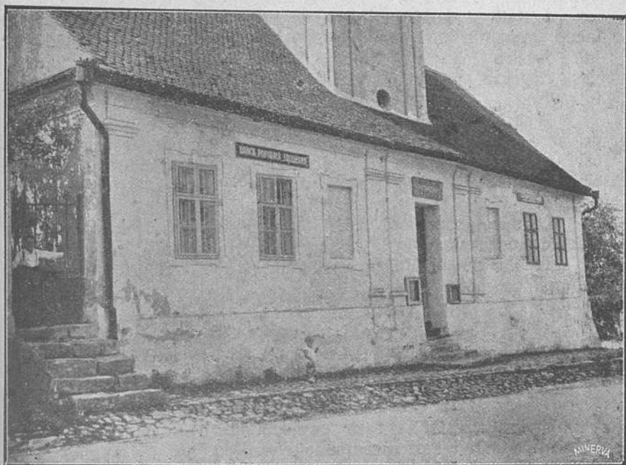
Banca Populară „Săceleană“