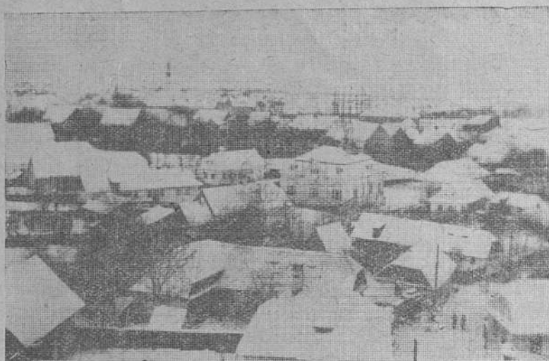
Săcelele pitorești (Satulung)

apele de apus ale Dunăii românești, în timpul cât ei din jur se organizeau în baza unor noi norme de viață.